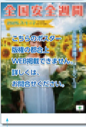
安全週間用ポスター (A) [スローガン入り]

別紙入れを添います (色入代はご注文数量、印刷色数により変動します。 別途お問い合わせください)